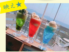
2 スハネフ 14-1