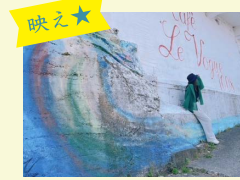
5 Le Vogue 1008