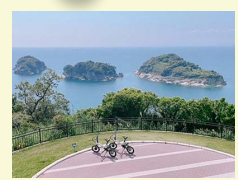
4 Ocean たかのすセンター