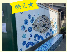
3 雑賀崎 Gatto Blu (ガットブル)