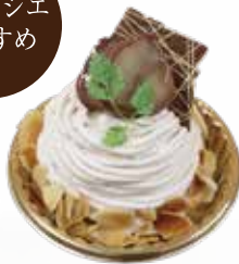
国産栗のモンブラン