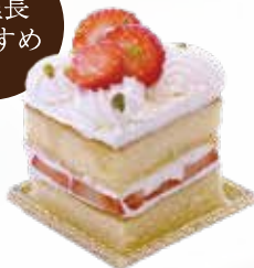
苺のショートケーキ