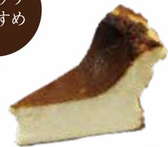
バスクチーズケーキ