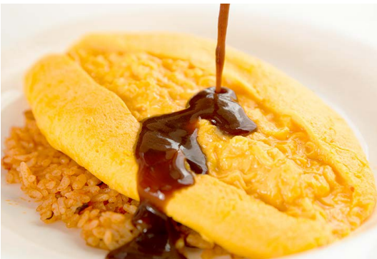
ふわとろオムライス Rice Omelet

ふわふわのとろとろたまごが自慢のオムライス。チキンライスには、食感が楽しめる4種のきのこ、旨みを引き立てるロースハムを合わせました。