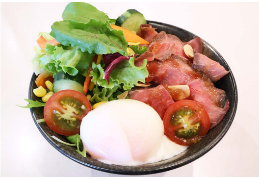
ローストビーフサラダ丼 (味噌汁セット) Roast Beef Salad Rice Bowl with Miso Soup

柔らかいローストビーフを、数種類の野菜が彩るパスワードの丼ぶり。温泉たまごを割るのも楽しみの一つ。