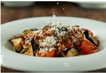
ミートスパゲティー Meat spaghetti

肉の旨味を生かし、じっくり炒めた野菜を煮込んで仕上げたミートスパゲティーです。お好みでチーズをかけてお召し上がりください。