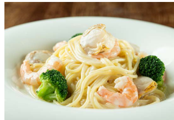
帆立と海老のクリームスパゲティー Spaghetti with scallop and shrimp cream